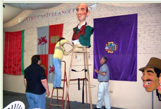
Cabezudos y banderas de Zamora, Castilla y León y Palencia en una fiesta del Centro Castellanoleonés de La Plata (2004)

Fondos del CEECyL (Centro de Estudios de la Emigración Castellana y Leonesa).