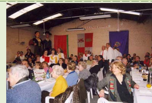
Asistentes a un evento del Centro Castellanoleonés de La Plata (2005)