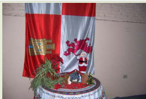
Navidad con Belén y Papa Noel en el Centro Castellanoleonés de La Plata (2003)