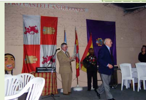
Discursos en una festividad del Centro Castellanoleonés de La Plata (2005)