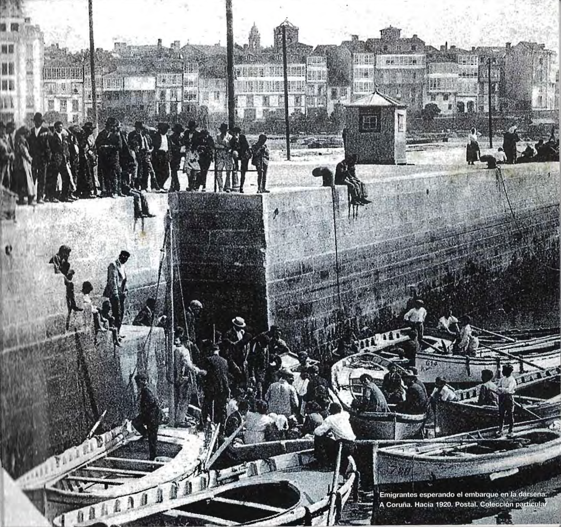
Emigrantes esperando el embarque en la dársena: A Coruña. Hacia 1920. Postal.