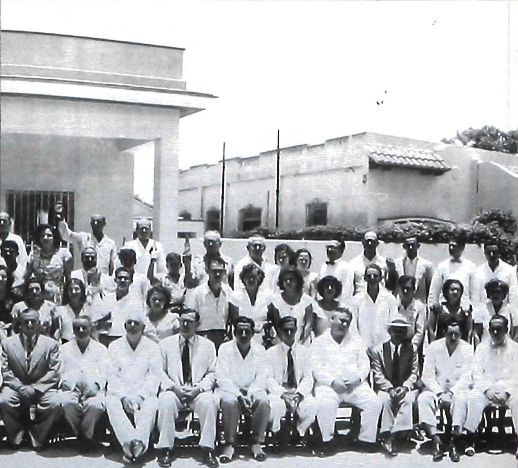
Sueños de la Memoria