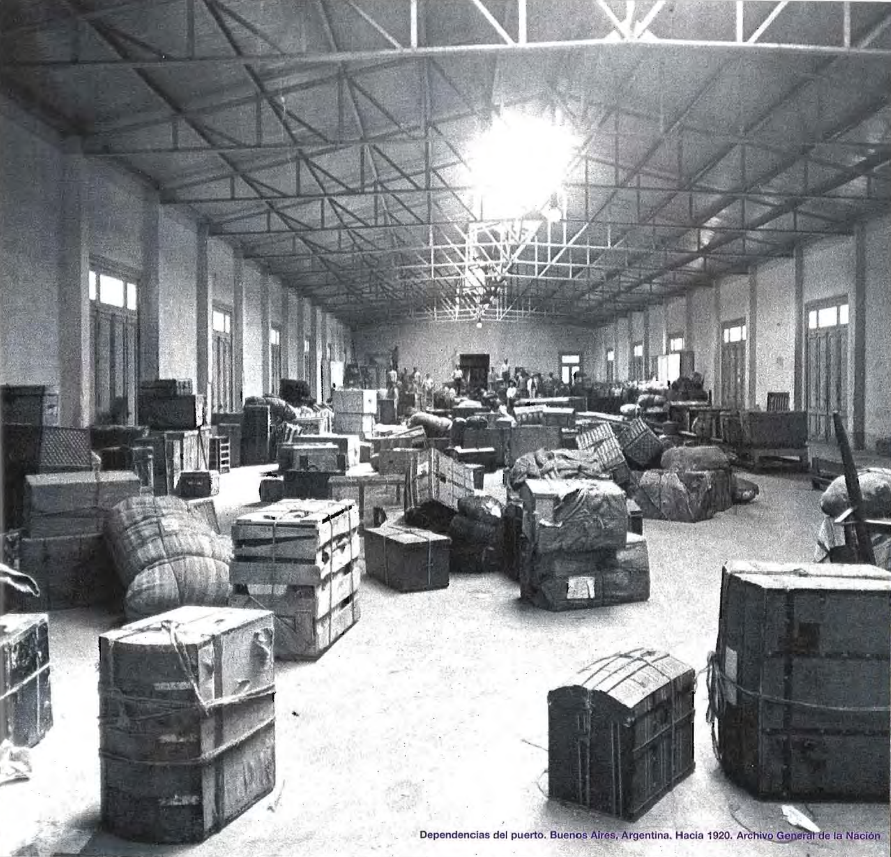
Dependencias del puerto. Buenos Aires, Argentina. Hacia 1920.