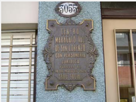
Placa a la entrada de la sede en el Centro Maragato Val de San Lorenzo (Buenos Aires)