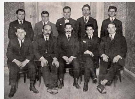
Primera comisión directivo del Centro Val de San Lorenzo (Buenos Aires)