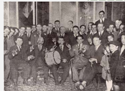
Fiesta del Centro Val de San Lorenzo donde se aprecia a dos hombres tocando instrumentos típicos maragatos: chifla y tamboril, y castañuelas