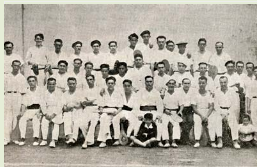
Jugadores del campeonato de pelota celebrado en el Centro Burgalés (1931)