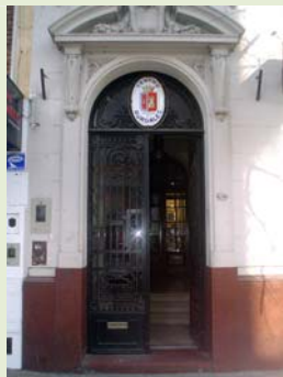
Entrada a la sede del Centro Burgalés de Buenos Aires (2003)

BIRENTZWAIG, Santiago; COPANI, Andrea; DUTTO, Gabriel; y MURPHY, Mariano. Centros Castellanos Leoneses de Argentina . Vigo: Grupo de Comunicación Galicia en el Mundo, 2012, p. 17-42. BLANCO, Juan Andrés. "Castilla y León en América: las asociaciones de los emigrantes". En BLANCO, Juan Andrés. Memorias de un sueño , Junta de Castilla y León, 2010, p. 376. CENTRO BURGALÉS. Centro Burgalés 1917-2005 . Buenos Aires: Centro Burgalés. https://casadecastillayleon.org.ar/centro-burgales/ (consultado en 05-09-2018) Fondos del CEECyL (Centro de Estudios de la Emigración)