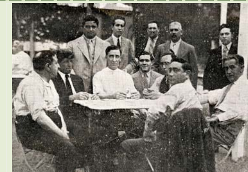
Partida de mus celebrada en el Centro Burgalés (1931)