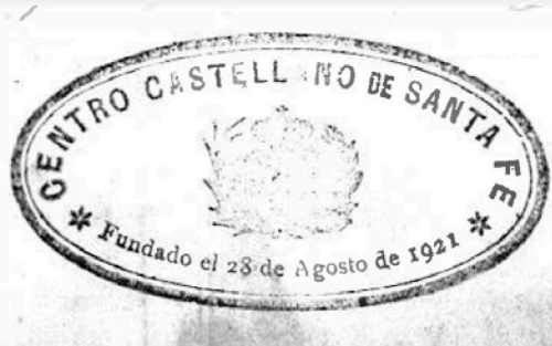
Sello del Centro Castellano de Santa Fe (1928)