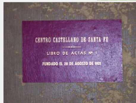
Portada del libro de actas nº 1 del Centro Castellano de Santa Fe (1928)