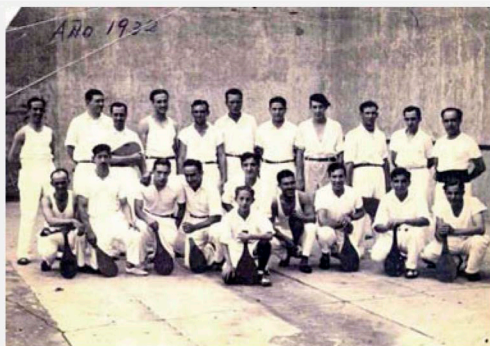
Emigrantes de origen castellano y leonés practicando alguna modalidad de frontón en Santa Fe (1932)